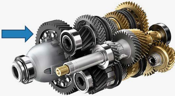
Polotovár koronového kolesa prevodovky pre Opel, Toyota